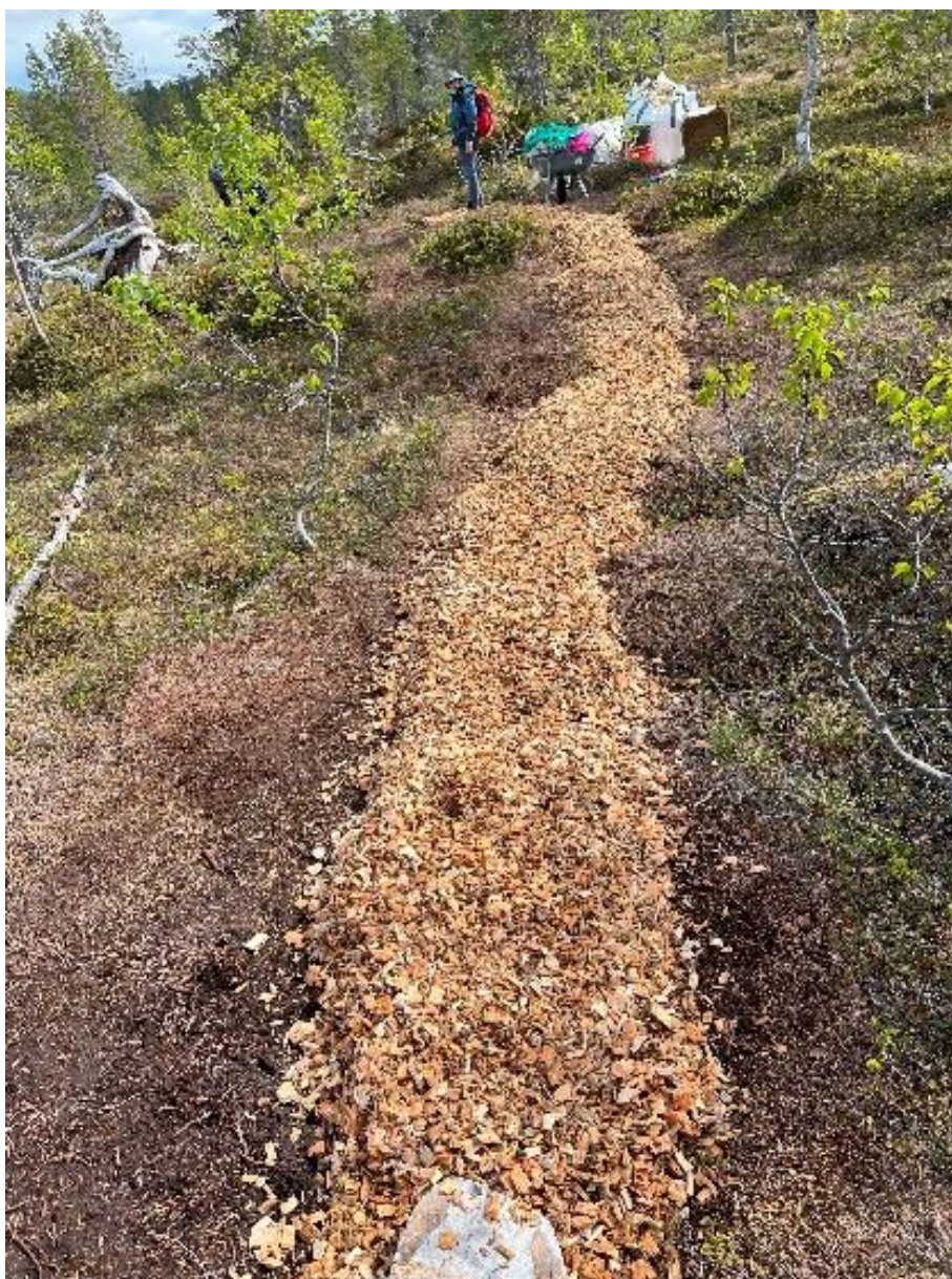
Arbeid med å legge furuflis på stien i rundløypen.

For 2025 er det behov for å legge ut furubark i stisegmenter på rundt 600 meter og bygge to trapper i tilknytning til rundløypen ved innfallsporten i Tranøybotn. Det er beregnet en kostnad på dette på kr. 80000,-