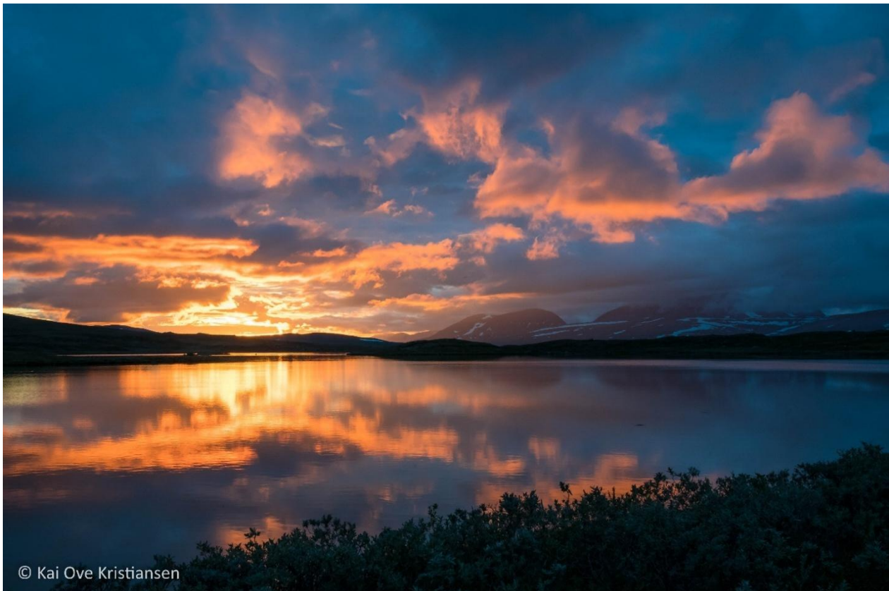
Solnedgang over Gárasjávri.

Tall fra hyttebøker. For åpne buer vil antall besøkende i realiteten være høyere da ikke alle skriver seg inn i hyttebøkene.