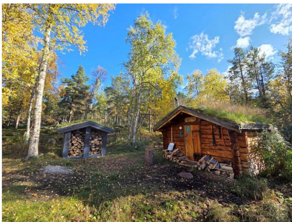
Ole Nergårdbua.

Tallene baserer seg på opptelte besøkende notert i hyttbøler og utleiestatistikk fra inatur.