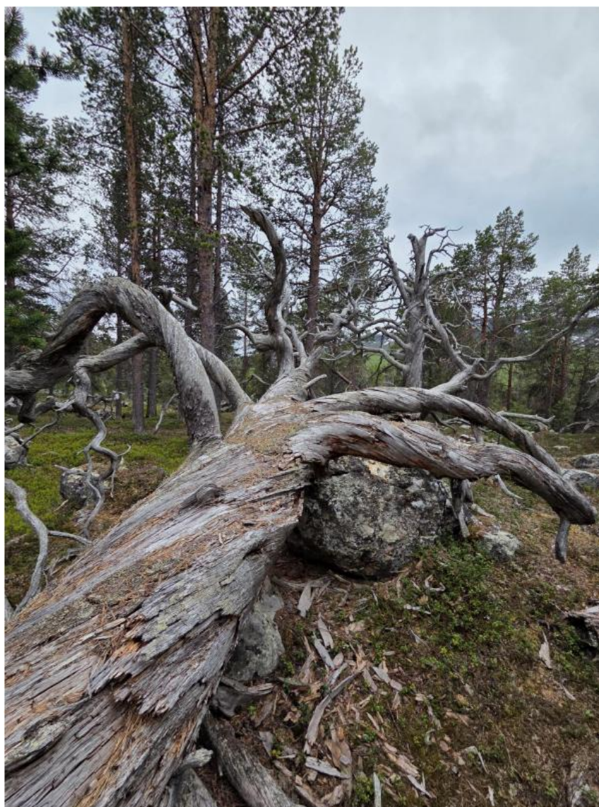
En av parkens seniorer.

Økende besøkstall fører til større forbruk av ved, og nasjonalparkstyret vurderer dette som et viktig skjøtselstiltak for å beskytte gammelfuruene i området. Uønsket bruk av tørrfuru som brensel er en av de største utfordringene i parken.