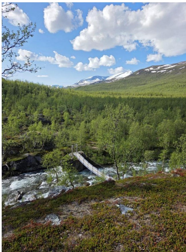
Brua over Vuomajohka.

Alle medlemmene i nasjonalpark-/verneområdestyret har et felles ansvar for en helhetlig forvaltning av verneområdene hvor ivaretagelse av verneverdiene og verneformålet er hovedoppgaven. Medlemmene av nasjonalpark-/verneområdestyret skal forvalte verneområdene i samsvar med internasjonale forpliktelser, naturmangfoldloven og verneforskriftene for det enkelte verneområde.