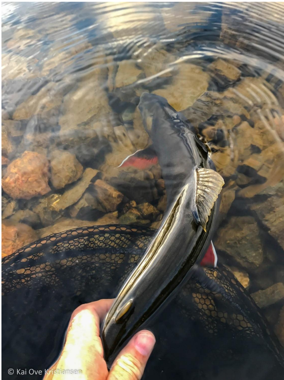
Middagen var sikret så denne Gárasrøya fikk friheten tilbake.

Styret og AU har jobbet med besøksstrategien våren 2025. Det er søkt om midler til besøkskartlegging og biologisk kartlegging for feltsesongen 2026. Med et styrket kunnskapsgrunnlag tas det sikte på å ferdigstille en besøksstrategi i løpet av vinteren 2026-27.