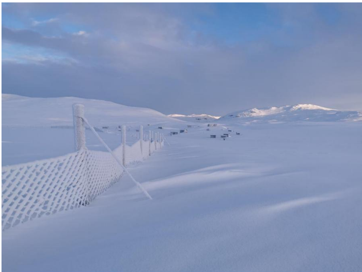
Čievčas i vinterdrakt.