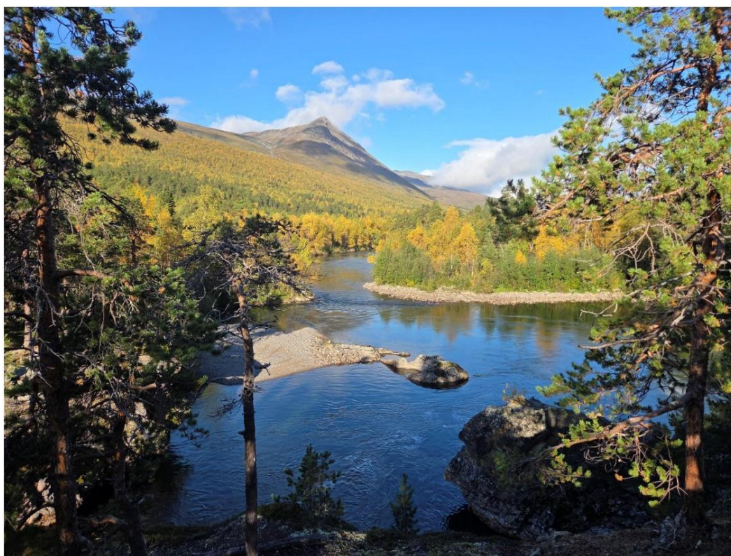
Divielva fra Landskapsvernområdet.