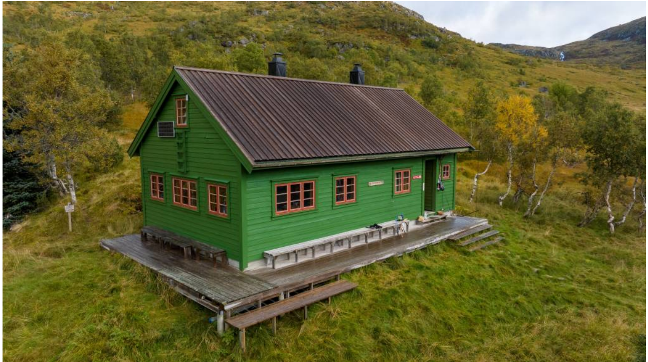
Figur 4: Turisthytta ved Solrenningane