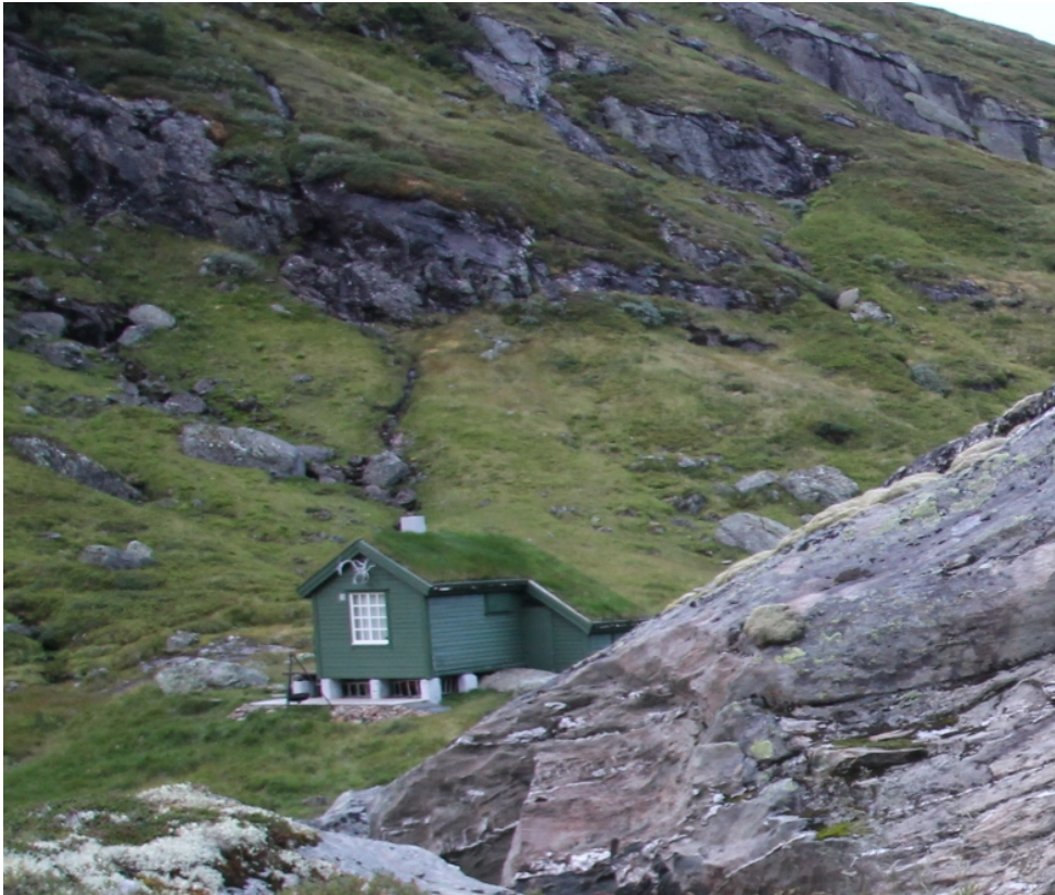
Figur 2. Bilde av treplattingen ved stølshuset i Mørkves-Grøndalen.