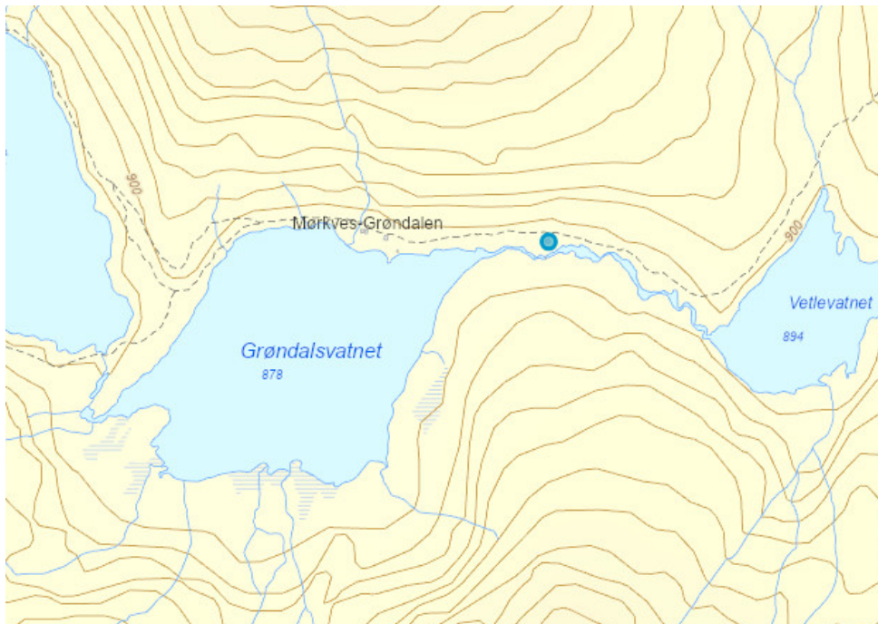
Figur 3. På kartet er stølshuset i Mørkves-Grøndalen markert med blå sirkel.