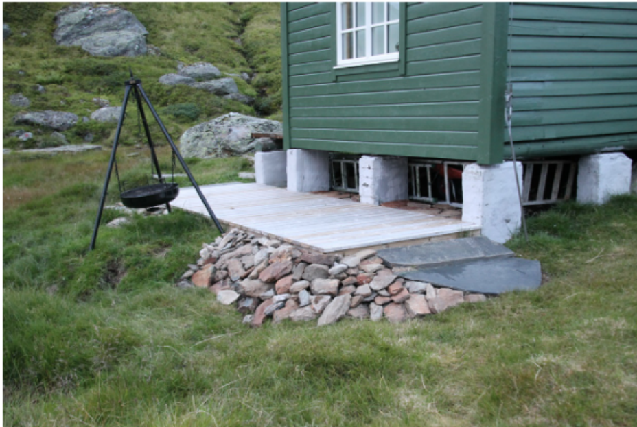
Figur 1. Bilde av treplattingen ved stølshuset i Mørkves-Grøndalen.

Det vart sett frist til å koma med utale til varselet innan 01.10.2024, og frist for retting av tiltaket vart sett til 01.11.2024. Etter søknad frå Mørkve om utsetting av fristen, gav styret ny frist til utale til 01.11.2024. Fristen for retting vart oppheva i påvente av uttalen.